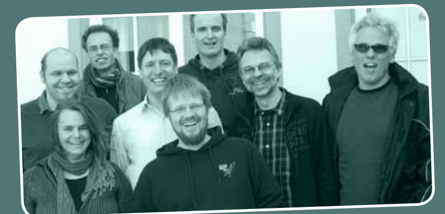
CVJM-Sekretärin & CVJM-Sekretäre des CVJM-Landesverbandes Baden

Solomon Benjamin, Kassel, www.cvjm-hochschule.de